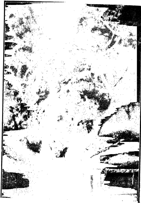
कुण्ठ के स्थानमें दुरर्ग वृ